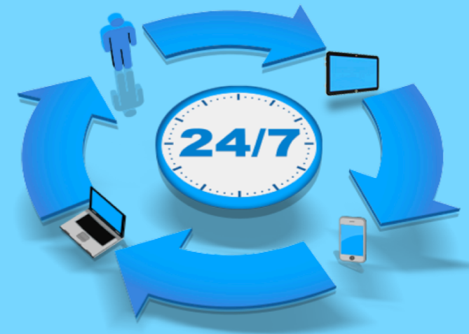
График работы Службы: 24-7-365